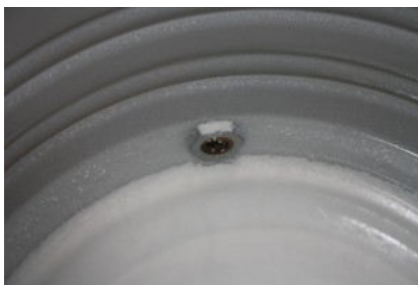
Beim Enthärten mit Kalkmilch fallen die unlöslichen Karbonate als kreidiges Sediment aus.

Im Falle von Calcium ist man jetzt fein raus, es fällt nämlich aus, und das Hydrogencarbonat wird ebenfalls entfernt. Bei Magnesium bildet sich aber das wasserlösliche Magnesiumcarbonat. Der Trick ist jetzt, dass man nur circa zwei Drittel des Brauwassers mit der gesamten Menge Kalkmilch behandelt, wobei man in den stark alkalischen Bereich kommt. Hierbei wird das Magnesiumcarbonat zu Magnesiumhydroxid hydrolysiert, das ebenfalls ausfällt. Dadurch kann man den Magnesiumgehalt ungefähr halbieren. Danach kann man das restliche Wasser zugeben und eventuell noch mit Milchsäure die Restalkalität vollends senken.