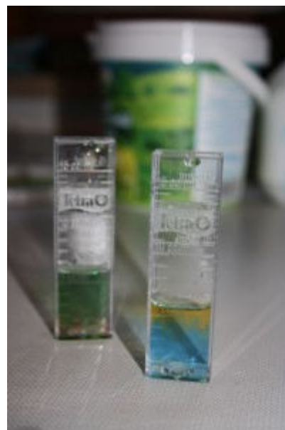
Im Zoohandel (Aquarienbedarf) gibt es preisgünstige Testsets, mit denen sich Gesamthärte (GH) und Karbonathärte (KH) per Titration bestimmen lassen.

sich, da es mangels Calciumionen beim Kochen keine Kalkflecken mehr gibt und man Waschmittel spart, der Hobbybrauer ärgert sich aber, sind doch Calciumionen für den Brauvorgang förderlich und Hydrogencarbonate unerwünscht.