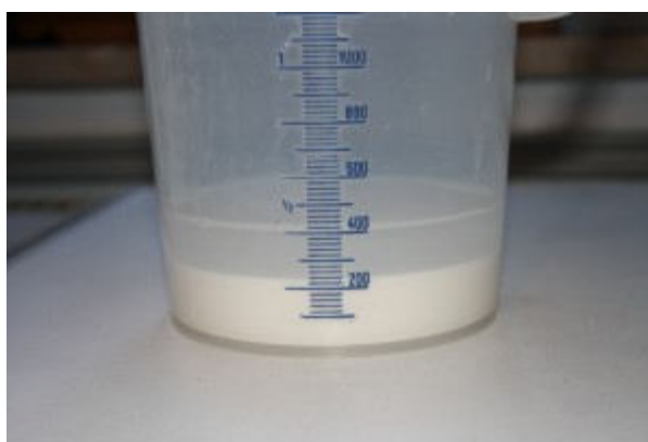
Dies aus 60 l Brauwasser ausgefällten Karbonate – eine beachtliche Menge!

60 Liter kaltes Leitungswasser vorlegen und 15 g Calciumoxid (entspricht 20 g Calciumhydroxid) zugeben und gut umrühren. Es entsteht eine milchige dünne Suspension. Der pH-Wert liegt dann nach einigen Minuten bei pH 11. Zusätzlich gebe ich noch 10 g Calciumchlorid-Dihydrat zu, Calciumsulfat noch nicht, da ich die